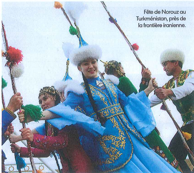
Fête de Norouz au Turkménistan, près de la frontière iranienne.

L'Inde du nord, du XIV e siècle jusqu'en 1857 (révolte des cipayes), fut profondément marquée par la Perse et la langue persane sous les règnes des souverains